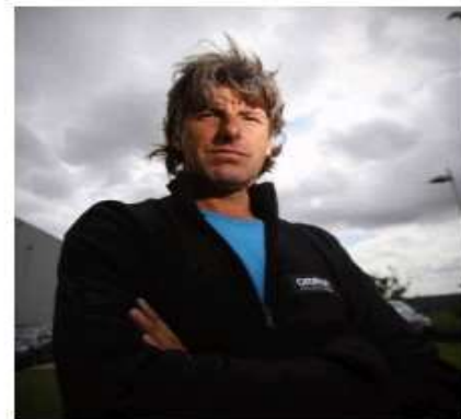
Engels, en una imagen de archivo.

Engels, de 48 años, hizo parte de su recorrido en Barcelona entre los días 2 y 8 de marzo y se propone recorrer también varias ciudades de España y de Europa para continuar con su objetivo.