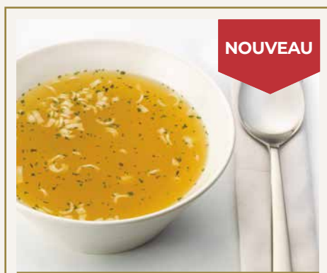
Soupe arôme Poulet et nouilles 041508 7 u./boîte 49,00 CHF