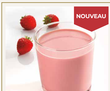
Smoothie saveur Yaourt fraise 042303 2 unités 19,60 CHF