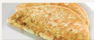
Omelette goût Fines herbes 041602 7 u./boîte 49,00 CHF