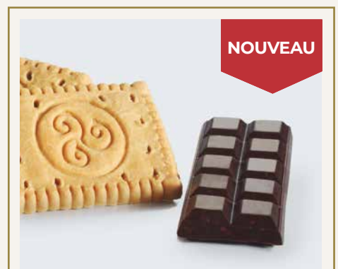
Biscuit et Chocolat Noir crunch 042325 5 u./boîte 52,00 CHF